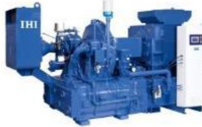
汎用ターボコンプレッサー