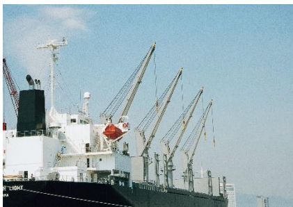
船用デッキクレーン