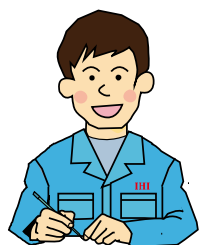
ものづくり推進部 F氏

サイクルタイムが長い工程では、分析に時間がかかり、改善をなかなか進められなかったのですが、TimePrismを作業分析に活用することで、分析時間を短縮でき、効率よくPDCAを回せるようになりました。